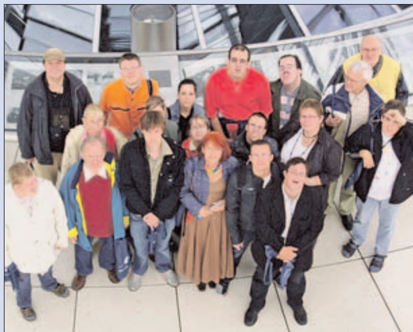
Die Reisegruppe des „BluePoint“ in der Reichstagskuppel von Berlin, nachdem die Abgeordnete Barbara Hendriks die Gruppe im Bundestag empfangen hatte.

die Teilnehmer mit großer Freude empfing. Nach einem persönlichen Gespräch, in dem den Teilnehmer alle Fragen beantwortet wurden, machte sich die Gruppe wieder auf dem Weg, um weitere Sehenswürdigkeiten der Hauptstadt zu sehen. Von der Kuppel des Reichstag aus konnten die nächsten Ziele schon bestaunt werden, unter anderem der Alex (Fernsehturm), das Brandenburger Tor, die jüdische Synagoge, der französische Dom u. v. m. Mit der Buslinie 100 erreichte die Gruppe nach einem spendierten Mittagessen in der Reichstagskantine schließlich das Holocaustdenkmal, welches alle sehr beeindruckte. Mit quälenden Füßen und guter Laune feierte die Gruppe in einem Restaurant in Berlin-Kreuzberg den Abschluss des Tages. Auf der Rückfahrt im ICE wurde angeregt über die Erlebnisse gesprochen. Es verabschiedeten sich alle Teilnehmer mit dem Wunsch, erneut einen Drei-Tage-Trip in eine Großstadt zu unternehmen.