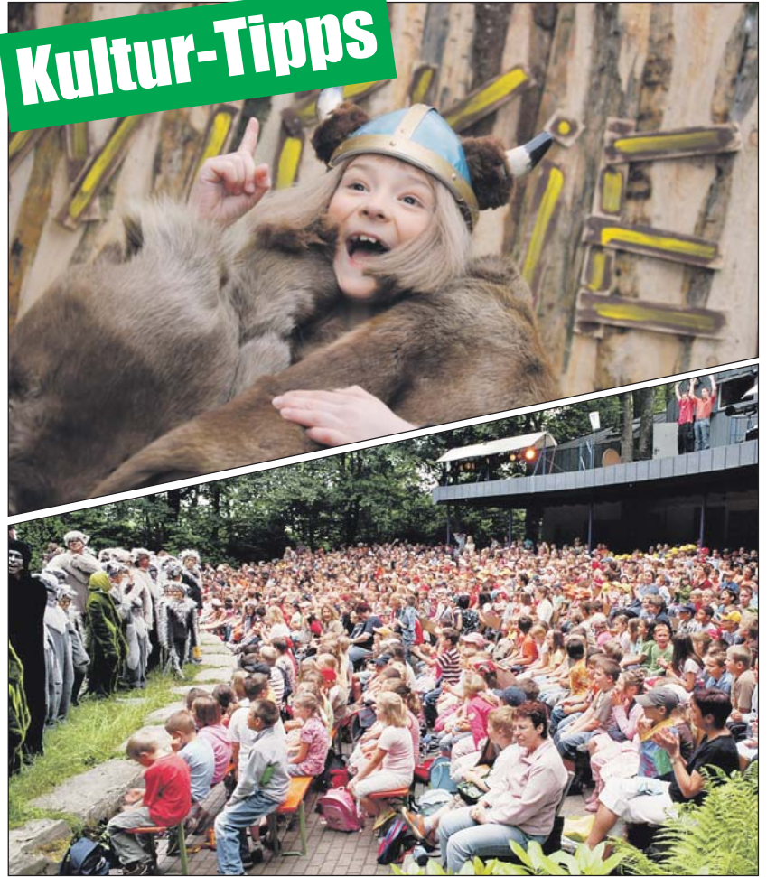
Abwechslungsreiches Programm wird auf der Waldbühne Heessen in Hamm und auf der Freilichtbühne Schloß Neuhaus geboten.