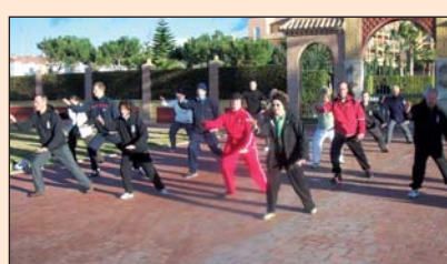
Schüler des Tai Chi Forums beim Ferienkurs an der Torrox Costa in Andalusien/Spainien.

Langsam geht eine Bewegung in die nächste über. Konzentriert werden die Übungen beim Tai-Chi-Chuan, einer jahrhundertalten, chinesischen Bewegungstechnik mit meditativer Ausrichtung, ausgeführt. Im Tai-Chi-Chuan als Entspannungstraining kommt es auf Weichheit und Geschmeidigkeit an. Die Muskulatur soll im Laufe der Zeit entspannt und die Gelen-