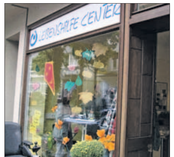
Lebenshilfe Center Hamm

Zurzeit gibt es neben dem Lebenshilfe Center in Hamm auch Center in Olpe, Netphen/Siegen, Gelsenkirchen, Gladbeck, Arnsberg und Duisburg. Weitere acht Center sind geplant. Infos im Internet unter www.lebenshilfe-nrw.de/einrichtungen suche