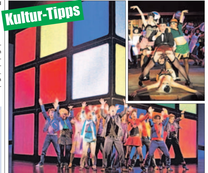
Reise in den Berliner Kit-Kat-Club der 20er-Jahre und in die Aufbruchstimmung der 80er.

Clifford Bradshaw, ein junger amerikanischer Schriftsteller, reist Ende 1929 nach Berlin, um dort ein Thema für seinen neuen Roman zu finden. Er kommt in einer Pension unter und lernt den Kit-Kat-Club kennen. In dem berühmtesten Club trifft Cliff den Star der Show, Miss Sally Bowles. Sally verliebt sich Hals über Kopf in Cliff und als sie ihren Job verliert, zieht sie zu ihm in