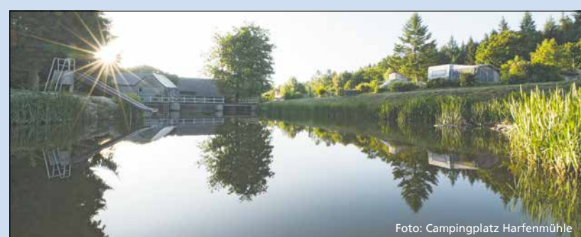
Idylle pur am See auf dem Campingplatz Harfenmühle

einen Tag kostenlos ausleihen können. Ob Wanderschuhe, Rucksack, Fernglas, Wanderjacke und noch einiges andere mehr – einfach anprobieren und loslaufen – Wald, Bäche und Felsen gibt es gleich nebenan zu erkunden.