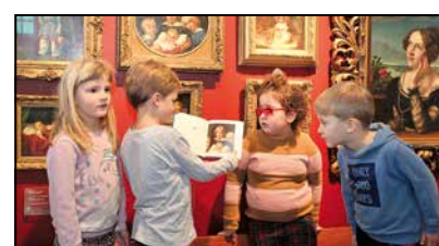
Die Kinder freuen sich über das neue Buch.

Ausgesucht wurden die Bildausschnitte bei einem Museumsbesuch von Vorschulkindern aus den Lebenshilfe-Kitas in Heinsberg und Waldfeucht-Haaren, an den sich ein Workshop in den Kitas anschloss. Im kleinformatigen Bildband wurden 50 Ausschnitte und Dialektbegriffe mit Übersetzungen ins Hochdeutsche, Englische, Französische und Niederländische veröffentlicht.