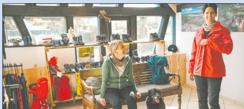
Testcenter für Wanderer: Moderne Ausrüstung kostenfrei ausleihen.

Wanderer können in der Region ab sofort einen einzigartigen Service in Anspruch nehmen: Der Campingplatz Harfenmühle beherbergt das neue Best of Wandern-Testcenter, in dem alle Gäste, die in der Region Urlaub machen, moderne und funktionale Wanderausrüstung für