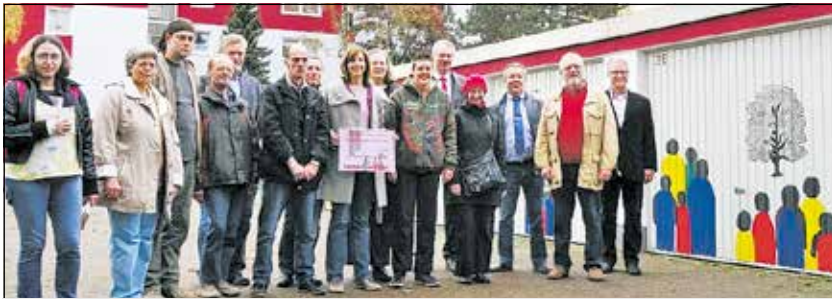
Künstler der Lebenshilfe, Mitarbeiter des Heimat- und Verkehrsvereins, der Interessengemeinschaft Schmachtendorf und der Immeo-Wohnen

Die Umrisse der Motive wurden mit dem Overheadprojektor und teilweise „frei Hand“ auf die Garagentore übertragen und anschließend mit Lackfarbe ausgefüllt. Auch bei diesem Projekt bekam das Team der Werkstatt am Kaisergarten sehr oft Lob von vorbeikommenden Passanten und Anwohnern; Kindern gefielen besonders die bunten Personen. Die Arbeiten