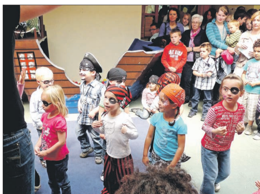
Unsere Bachpiraten beim Tanz.

Insbesondere der Linnicher Einzelhandel hatte es sich nicht nehmen lassen, mit zahlreichen Spenden zum Gelingen des Festes beizutragen. Auch dafür ein herzliches Dankeschön.