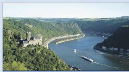
Tolle Aussicht auf die Burg Katz und die Loreley.

Natur ist Trumpf entlang des Rheinsteigs, an den Höhen von Siebengebirge, Westerwald und Tau-