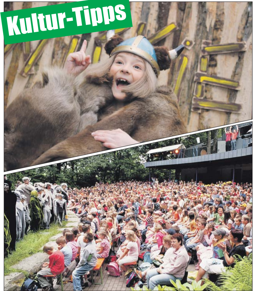
Abwechslungsreiches Programm wird auf der Waldbühne Heessen in Hamm und auf der Freilichtbühne Schloß Neuhaus geboten.