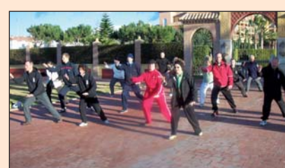
Schüler des Tai Chi Forums beim Ferienkurs an der Torrox Costa in Andalusien/Spainien.

Langsam geht eine Bewegung in die nächste über. Konzentriert werden die Übungen beim Tai-Chi-Chuan, einer jahrhundertealten, chinesischen Bewegungstechnik mit meditativer Ausrichtung, ausgeführt. Im Tai-Chi-Chuan als Entspannungstraining kommt es auf Weichheit und Geschmeidigkeit an. Die Muskulatur soll im Laufe der Zeit entspannt und die Gelen-