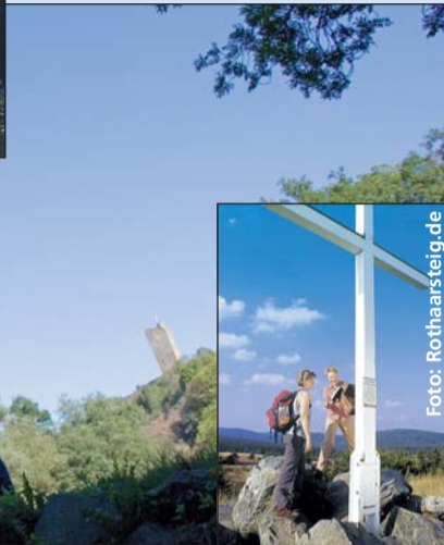
Wanderer auf dem Rothaarsteig.

nus ebenso wie an den steilen Talhängen des Rheintals. Beliebter Einstieg bei Wanderern: im Rheingau, denn hier verläuft der Weg nicht durch Schluchten, sondern über sanfte Hügel und Rebhänge mit tollem Panoramablick ins Rheintal.