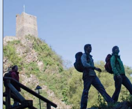
Wanderer auf dem Eifelsteig vor dem Kloster Himmerod in Manderscheid.