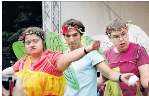
„Rock meets Dance“ – selbst geschriebenes Musical mit eigens komponierter Musik.

senheit und eine tolle Atmosphäre. Direkt am nächsten Tag ging es weiter nach Gelsenkirchen, wo die Band und die Tänzer in ihren zaubernden Kostümen die Besucher der Veranstaltung „Total normal“ mit „Rock meets Dance“ begeisterten.