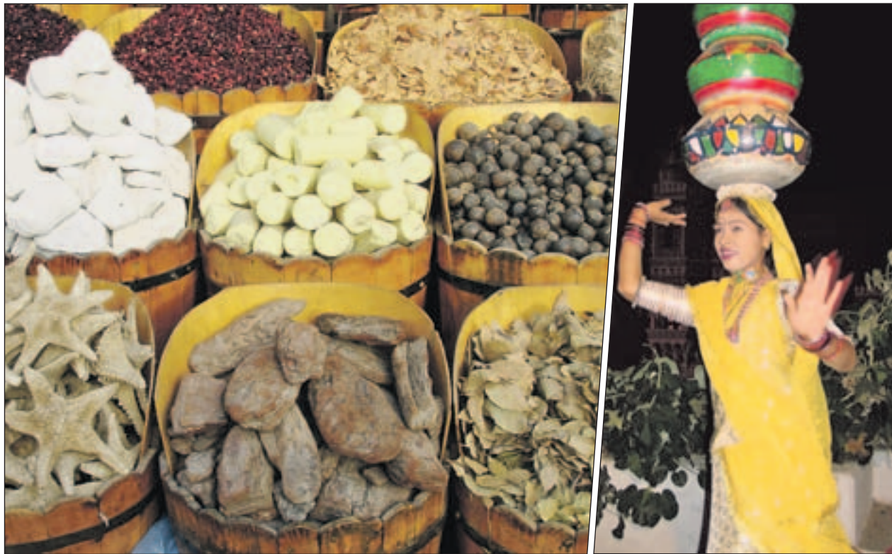
Eindrücke einer anderen Welt: indische Gewürze und indische Tänzerin.