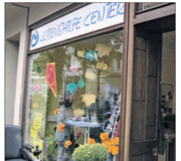
Lebenshilfe Center Hamm

Zurzeit gibt es neben dem Lebenshilfe Center in Hamm auch Center in Olpe, Netphen/Siegen, Gelsenkirchen, Gladbeck, Arnsberg und Duisburg. Weitere acht Center sind geplant. Infos im Internet unter www.lebenshilfe-nrw.de/einrichtungen suche