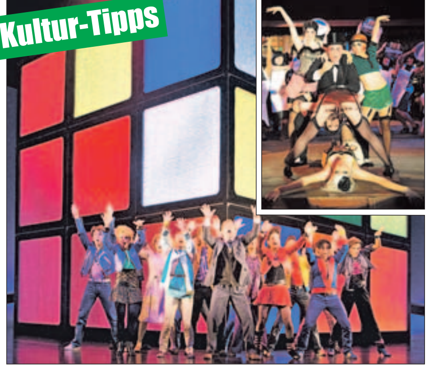
Reise in den Berliner Kit-Kat-Club der 20er-Jahre und in die Aufbruchstimmung der 80er.

Ich will Spaß! Das 80er Hit Musical mit den Hits der Neuen Deutschen Welle nimmt die Zuschauer im Colosseum-Theater in Essen mit auf eine Achterbahnfahrt der Gefühle. Eine Geschichte über Familie, Rebellion und wahre Liebe: aufregend und witzig, leise und nachdenklich, launisch und wild. Die Charaktere bewegt, was unsere Gesellschaft in den 80er-Jahren geprägt hat und heute noch beschäftigt: Friedensaktivismus, Generationskonflikte, veränderte Rollen von Mann und Frau. Die Suche nach der großen Liebe und dem eigenen Platz im Leben. Jeder will seine Träume verwirklichen, unabhängig sein – und Spaß haben. Tickets und Infos gibt es unter (0 18 05) 44 44 oder www.musicals.de