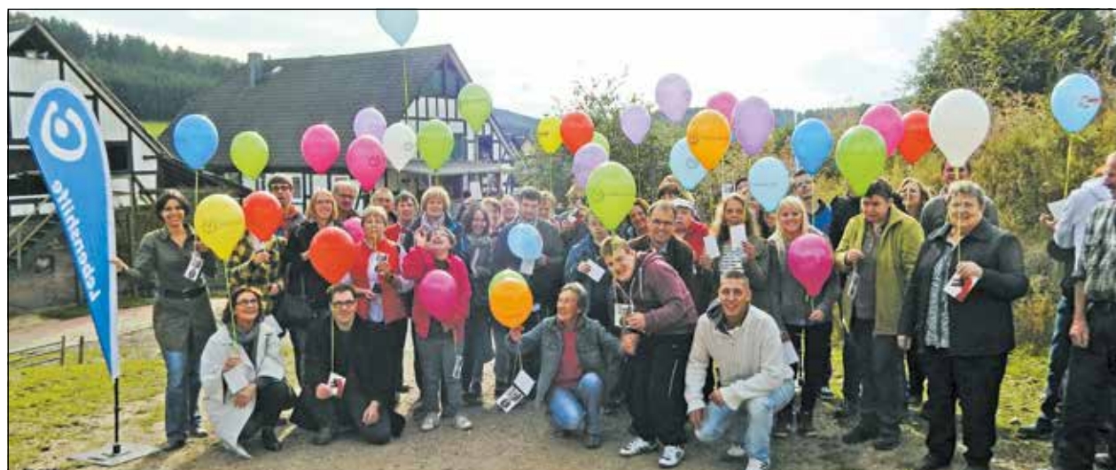
Zahlreiche Besucher kamen zum Hoffest in Selbecke.