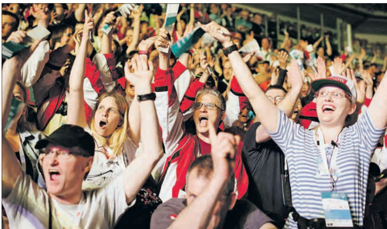
Die Stimmung bei der Eröffnungsveranstaltung im ISS Dome war fantastisch.