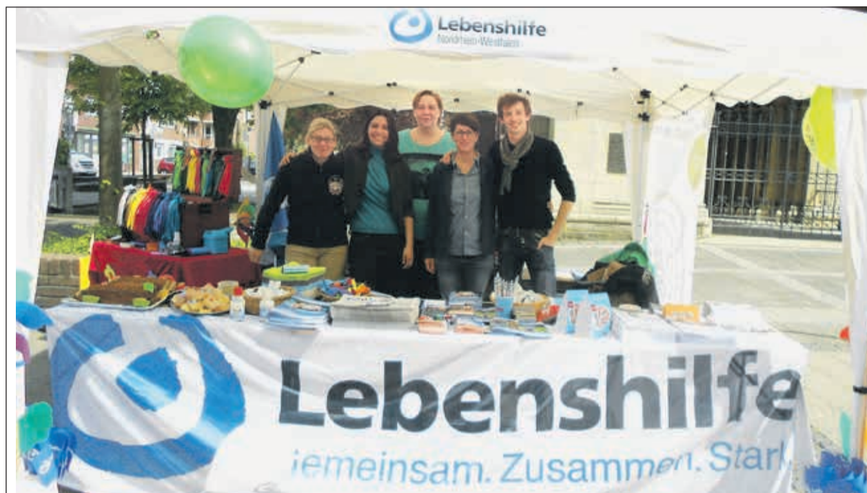
Das Lebenshilfe Center-Team präsentierte die Angebote am Stand.

... noch viel mehr vor: Lebenshilfe Center Coesfeld informiert an einem Aktionsstand