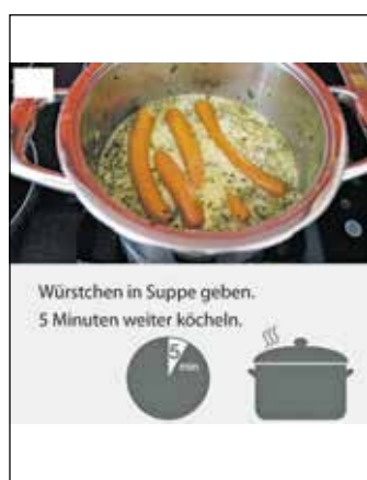
Würstchen in Suppe geben. 5 Minuten weiter köcheln.

Auszüge des Rezeptes in Leichter Sprache