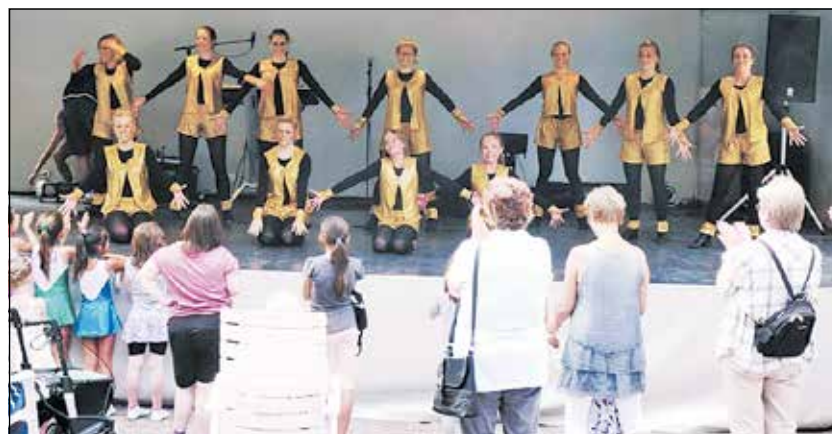
Tanzgruppe „Tanzsterne“ und Zuschauer