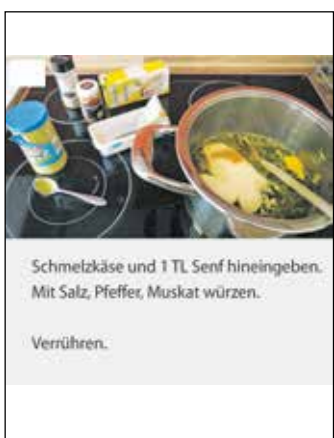
Schmelzkäse und 1 TL Senf hineingeben. Mit Salz, Pfeffer, Muskat würzen. Verrühren.

Aus: Kochwerkstatt des Familienunterstützenden Dienstes der Lebenshilfe Heinsberg in Leichter Sprache (Seite 4)