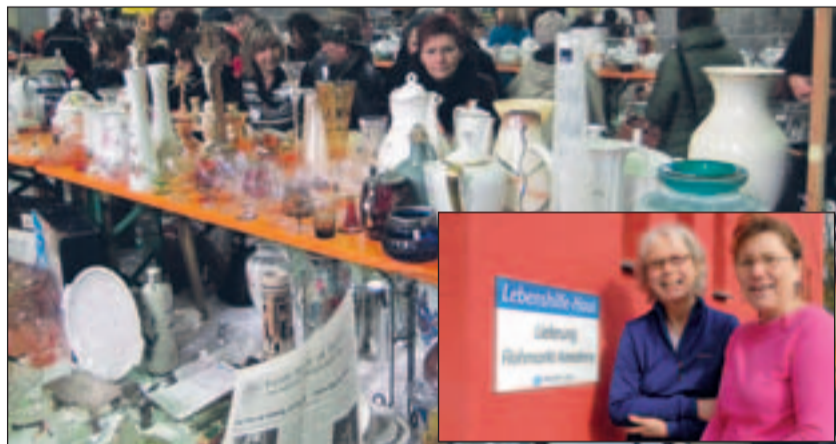
Trubel auf dem Flohmarkt in Aachen.

Voraussetzung für alle drei Dienste ist das Interesse am Einsatzgebiet im sozialen Bereich und der Begleitung und Unterstützung von Menschen mit Behinderung. Im Gegenzug erhalten die Engagierten eine Vergütung sowie eine gute praktische und theoretische Qualifizierung und Begleitung durch Fachkräfte – und zahlreiche positive Erfahrungen und persönliche Entwicklungen. Weitere Infos unter www.mein-lebenshilfe-jahr.de