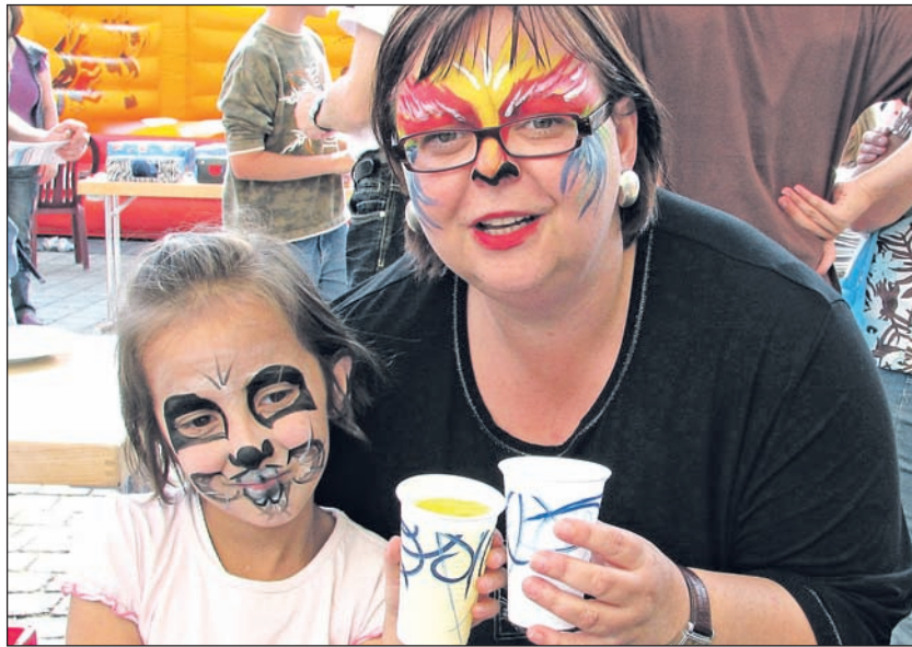
Die Schminkeaktion brachte Spaß für Groß und Klein.

Von Marc Wimbert und Christoph Brune. Eine große Spielrallye mit sieben verschiedenen Geschicklichkeitsspielen (Entenangeln, Stiefelwerfen, Autos aufrollen, das Centgrab, den heißen Draht und Fühlkästen, Hüpfkästchen), eine Hüpfburg für Kinder und eine Kinderschminkeaktion – das Sommerfest des Lebenshilfe Centers in Arnsberg auf dem Gutenbergplatz brachte kleinen und großen Teilnehmern viel Spaß.