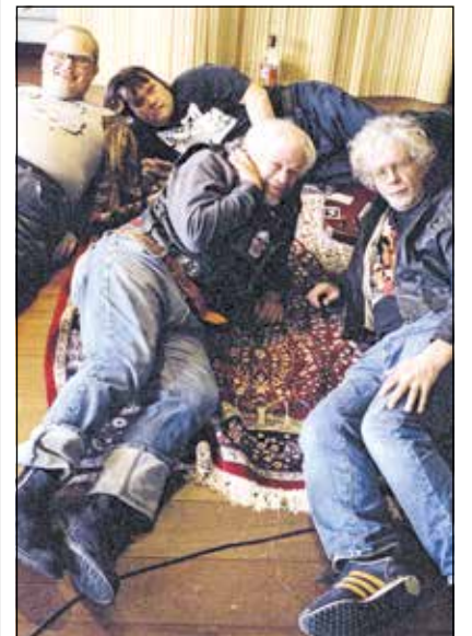
Die Punkband PKN

Drei der Mitglieder von PKN haben das Down-Syndrom, einer ist Autist. Zusammen sind sie eine waschechte Punkband. Texte über soziale Probleme passen, das Bier in der Hand haut hin und auch die Jeansknoten voller Band-Aufnäher sind stimmig.