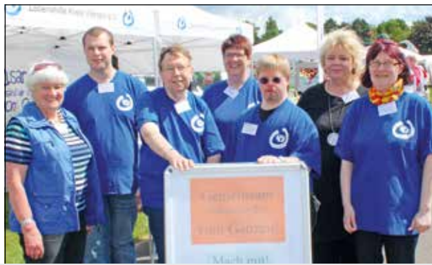
Zahlreiche Mitmach-Aktionen an den Ständen der Lebenshilfe Oberhausen (o. l./Karaoke), der Lebenshilfe Kreis Viersen (o. r./Malen) und der Lebenshilfe NRW (u. l./eine Form des Malens). Der Lebenshilfe Rat Kreis Viersen war auch dabei (u. r.).