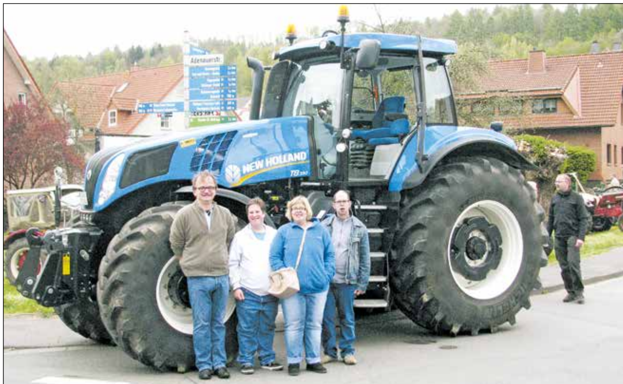
Modern und riesig: Ein Traktor der jüngeren Generation