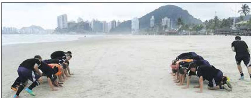
Die Mannschaft beim Training ...

Nach bereits zwei Niederlagen gegen Japan und Polen folgte nun die Dritte gegen Schweden, im Entscheidungsspiel um den vorletzten und letzten Platz. Nun wird es eine wichtige Aufgabe des Trainerteams sein, die Ursachen dieser Niederlagen zu erforschen, um mögliche Fehlerquellen beseitigen zu können. Allerdings ist den deutschen Spielern hoch anzurechnen, dass sie trotz der vielen Frustrationserlebnisse bis zum Schlusspfeiff Einsatzwillen und Laufbereitschaft gezeigt haben. Die beiden Tore der Schweden sind durch Fehler in der