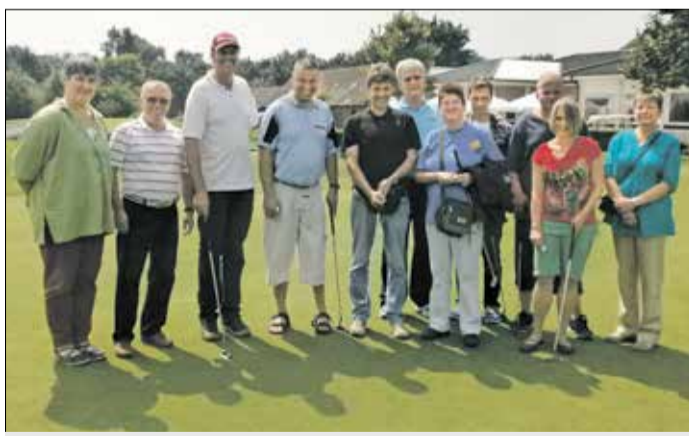
Benefiz-Golfturnier mit Spaßcharakter: Sportler mit Handicap übten Abschläge auf der Anlage des Golfclubs Röttgersbach.

E in besonderer Tag war der 26. Juli in diesem Jahr für die sechs Sportler mit Behinderung, Mitglieder der Sportabteilung der Lebenshilfe Oberhausen. Sie nahmen zum ersten Mal am Benefiz-Golfturnier des Golfclubs Röttgersbach e. V., das seit vielen Jahren am „Zwei-Städte-Eck“ Duisburg und Oberhausen zugunsten der Lebenshilfe Oberhausen e. V. stattfindet.