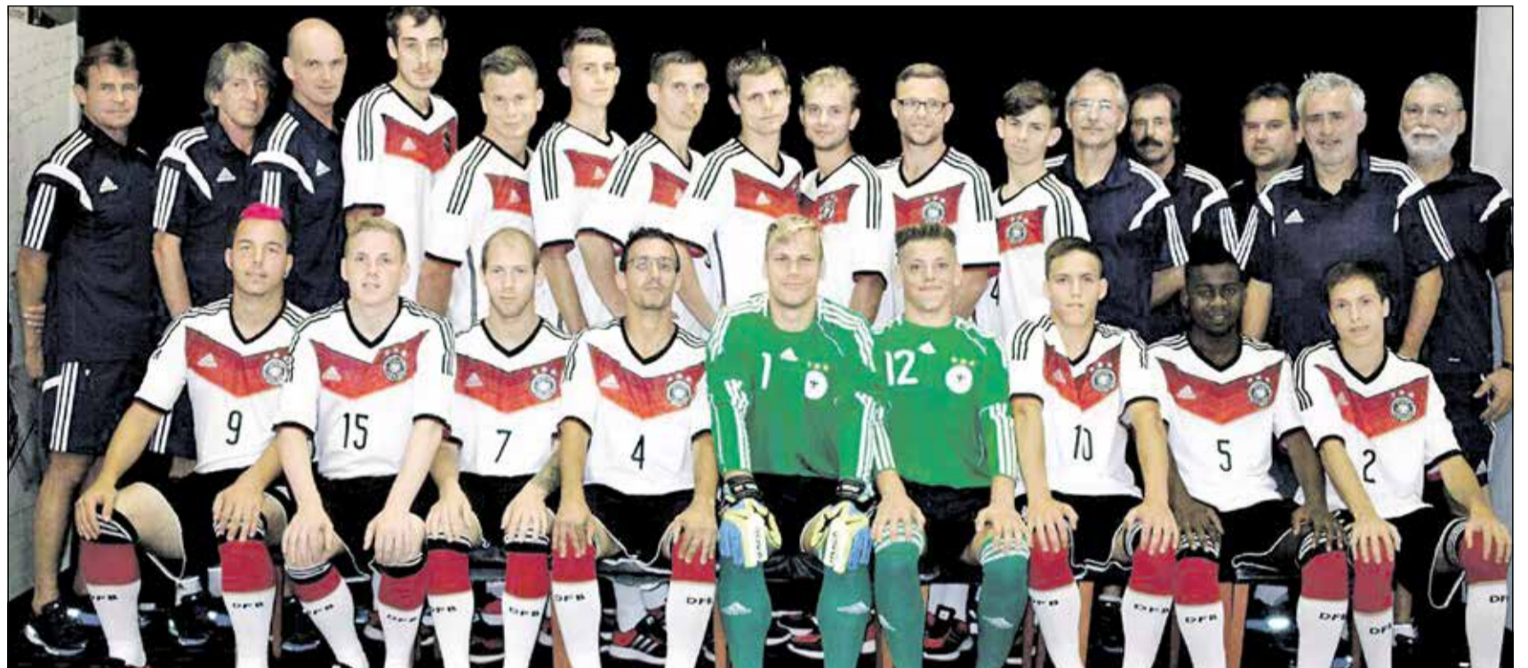
Gemeinsam stark: das Team der Deutschen Nationalmannschaft mit intellektueller Beeinträchtigung

Deutsche Nationalmannschaft verliert auch gegen Schweden bei Fußball-WM ID in Brasilien vom 13. bis 22. August und belegt Platz acht