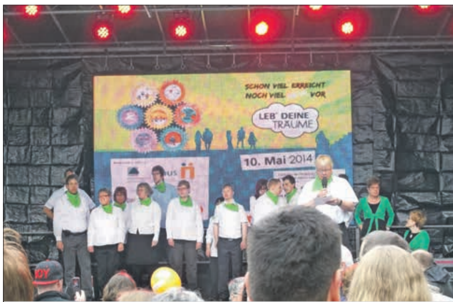
Zwei Bewohner des Haus Lebenshilfe Altenbeken waren dabei.

Zwei Bewohner des Haus Lebenshilfe Altenbeken ließen sich die Chance nicht nehmen, für ihre Rechte auf die Straße zu gehen. Angereist mit dem Zug, waren sie zunächst von den Menschenmassen, die die Westernstraße säumten, begeistert. Eine Stunde zogen die Demonstranten mit ihren Plakaten und lauten Pfiffen durch die Innenstadt, bis sie zum Rathausplatz gelangten, um dort einem Bühnenprogramm zu folgen. Neben Podiumsdiskussionen