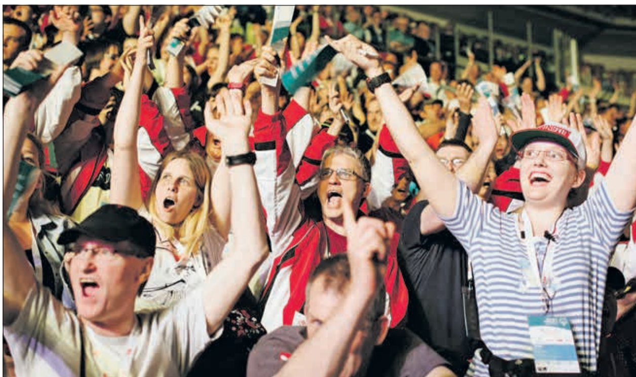
Die Stimmung bei der Eröffnungsveranstaltung im ISS Dome war fantastisch.