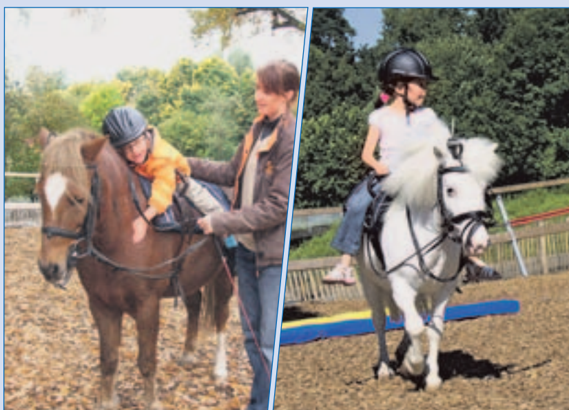
Auf dem Rücken der Pferde macht das Leben Spaß.

Bei den Kindern des Kindergartens in der Lintertstraße ist die