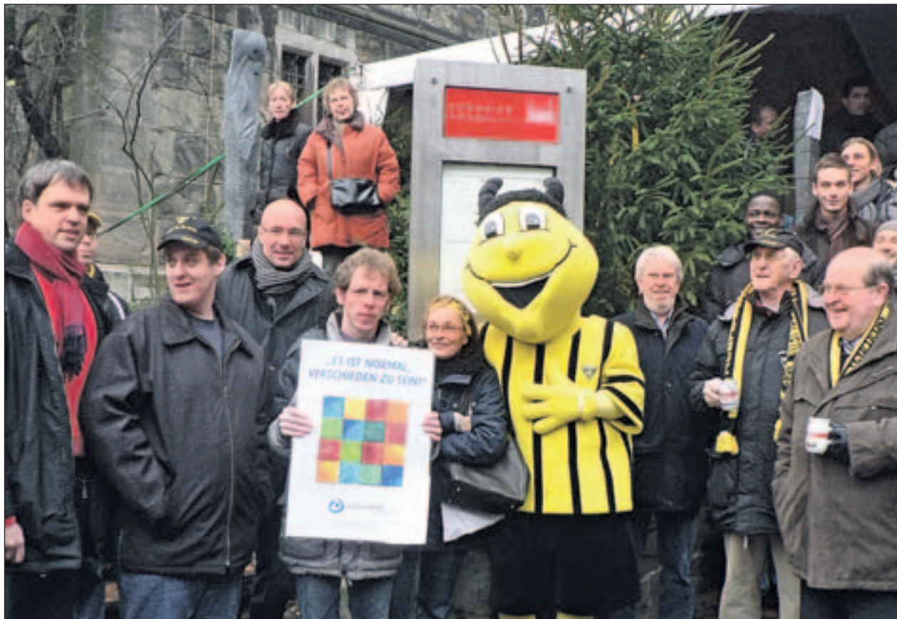
Neue Sozialpartnerschaft zwischen Alemannia und der Lebenshilfe.

gemeinen und die Alemannia-Begeisterung im Speziellen ist bei der Lebenshilfe ohnehin greifbar. In Werkstätten und Wohnheimen begegnet einem das Wappen des Klubs immer wieder. Nun wird aus