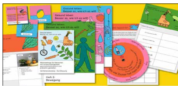
Sammelkiste