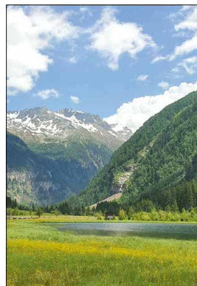
Unterwegs im Tauerntal ... und im Seebachtal mit dem Stappitzer See