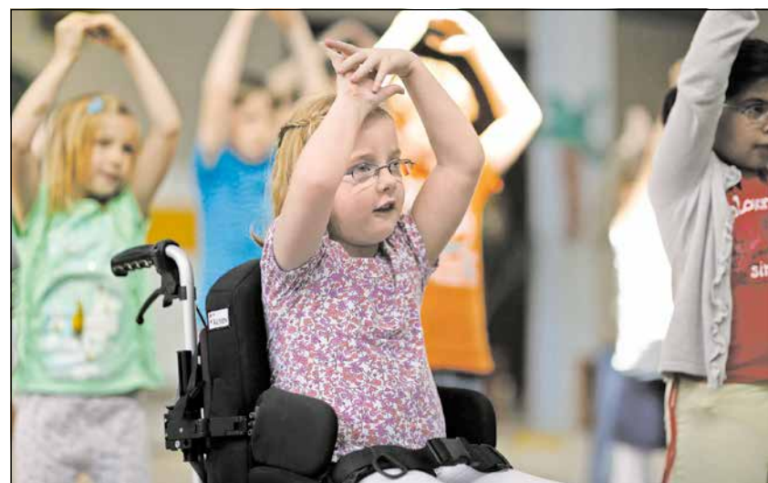
Manche Kinder brauchen besondere Unterstützung.

Die Umsetzung der BTHG geführten Gruppen in das KIBiz (Kinderbildungsgesetz) des BTHG sei in dem Zusammenhang eine echte Herausforderung, für Elke Wimmer ist es auch eine Chance. „Die angekündigte Auflösung der heilpädagogischen Gruppen zwingt uns, genau zu schauen, was die Kinder wirklich brauchen“, sagt Wimmer. „Und es zwingt uns, entsprechende Lösungen zu finden und gibt uns die Möglichkeit, über neue Konzepte nachzudenken.“