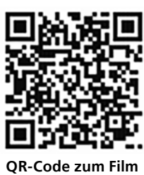
QR-Code zum Film

Insgesamt haben zehn Teams aus zehn Ländern teilgenommen: Irland, England, Niederlande, Belgien, Frankreich, Spanien, Portugal, Italien, Tschechien und Deutschland, pro Mannschaft waren zehn Spieler:innen dabei. Das Turnier startete sonntags mit einem großen Fest zum Kennenlernen. Jede Nation hatte eine landestypische Choreografie mit Musik einstudiert. Manche waren dabei traditioneller, manche moderner, manche moderner.