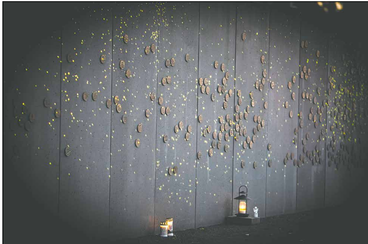
Lichter der Erinnerung

Zu ihrer Kindheit in den Konzentrationslagern sagte sie: „Viele meinen, Kindern war gar nicht klar, was geschah.“ Aber: „Wir Kinder waren hellwach, vielleicht nie wieder so hellwach wie damals. Während und nach dem Krieg“, führte Ruth Klüger weiter aus, „hat man die Ermordung einer ganzen nicht-politischen Zivilbevölkerung wenn nicht beiseitegeschoben, so doch