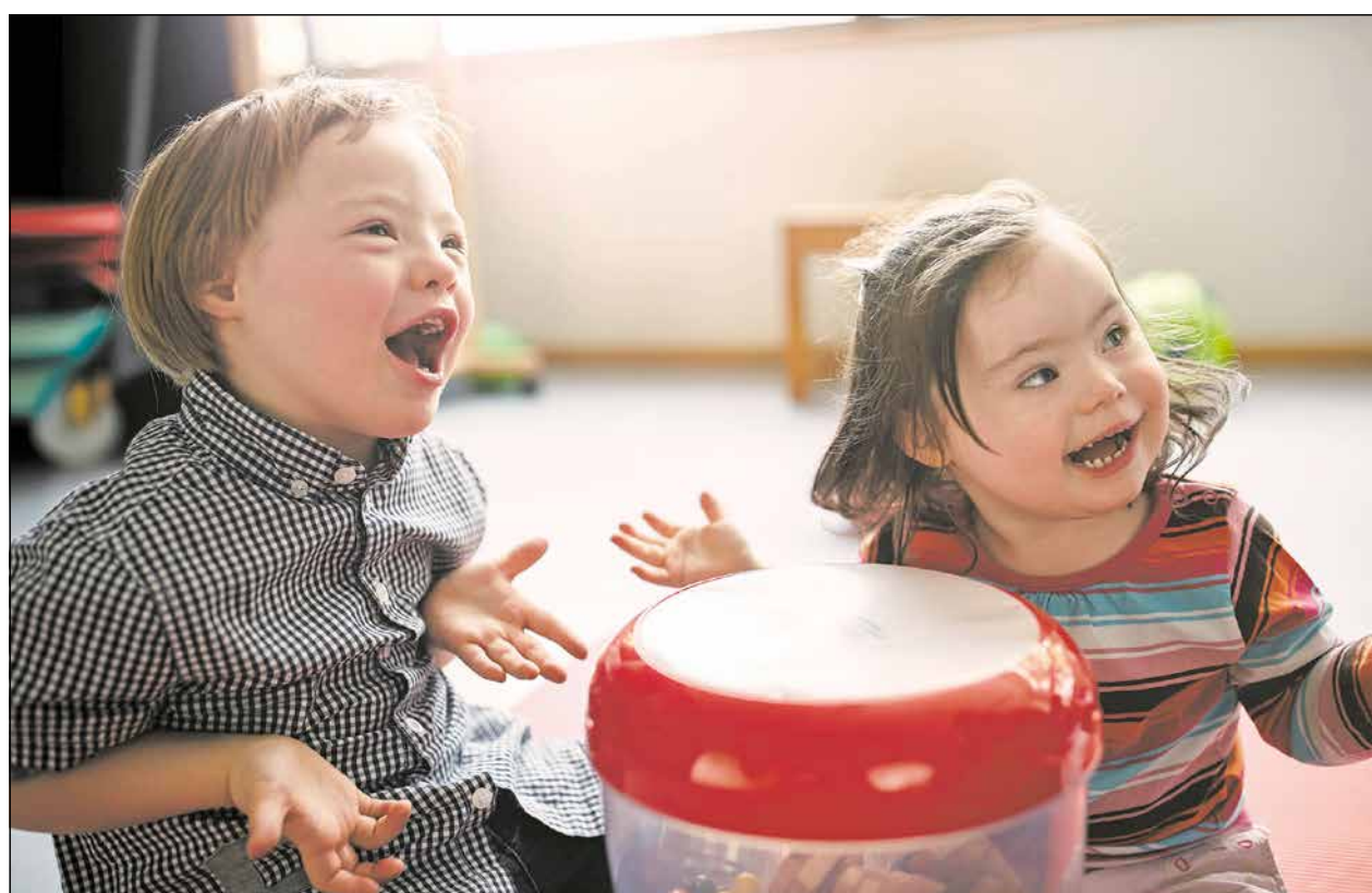
Miteinander lernen und Spaß haben – die Bedürfnisse des einzelnen Kindes stehen bei der Lebenshilfe-Kita im Vordergrund.

Elke Wimmer ist zuständig für die vier Lebenshilfe-Kitas in der Stadt Düren (Eschfeldmäuse und Pustebume) und die beiden Lebenshilfe-Kitas auf dem Gebiet des Kreises Düren, in Linnich (Bachpiraten) und Vettweiß-Kelz (Knirpsenland) sowie die Interdisziplinäre Frühförder- und Frühberatungsstelle. Rund 65 pädagogische Fachkräfte arbeiten in den Einrichtungen, etwa 250 Kinder, davon 85 mit Förderbedarf werden dort betreut.