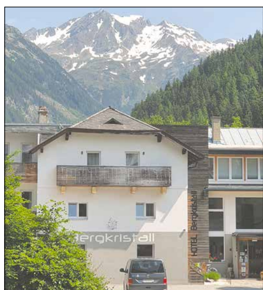
Hotel Bergkristall in wunderschöner Lage

Entspannung auf dem Programm. Gleich beim Hotel gab es ein kleines Kneipp-Gartl, in dem die 42-Jährige jeden Tag nach der Wanderung ihre Kneippgüsse machte, ging zum Schwimmen ins Tauernbad und besuchte die Nationalparkausstellung im modernen Besucherzentrum in Mallnitz. „Es war ein wunderbarer Urlaub. Ich kann es kaum erwarten wieder hinzufahren.“ vw