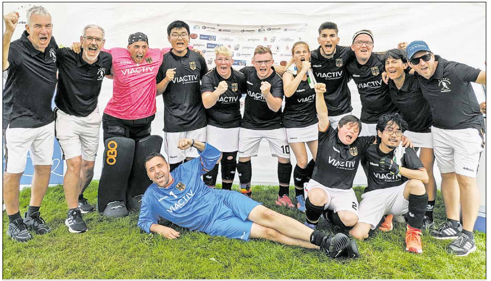
Riesenfreude über den Gewinn des EM-Titels

Montags begannen die Klassifizierungsspiele. Deutschland wurde in die zweite Gruppe eingestuft.