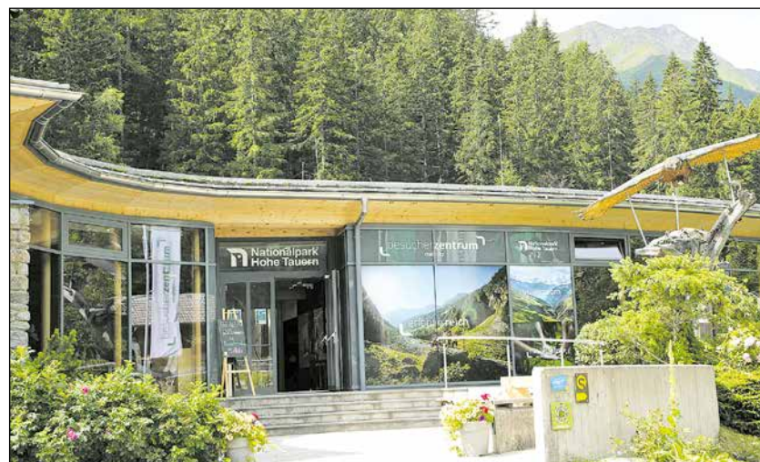
Nationalpark-Besucherzentrum in Mallnitz